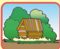
工作物の新築・増築・ 改築・移転又は撤去