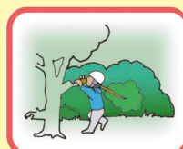
竹木その他 規則で定める物の伐採