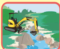
土石(砂を含む)の採取