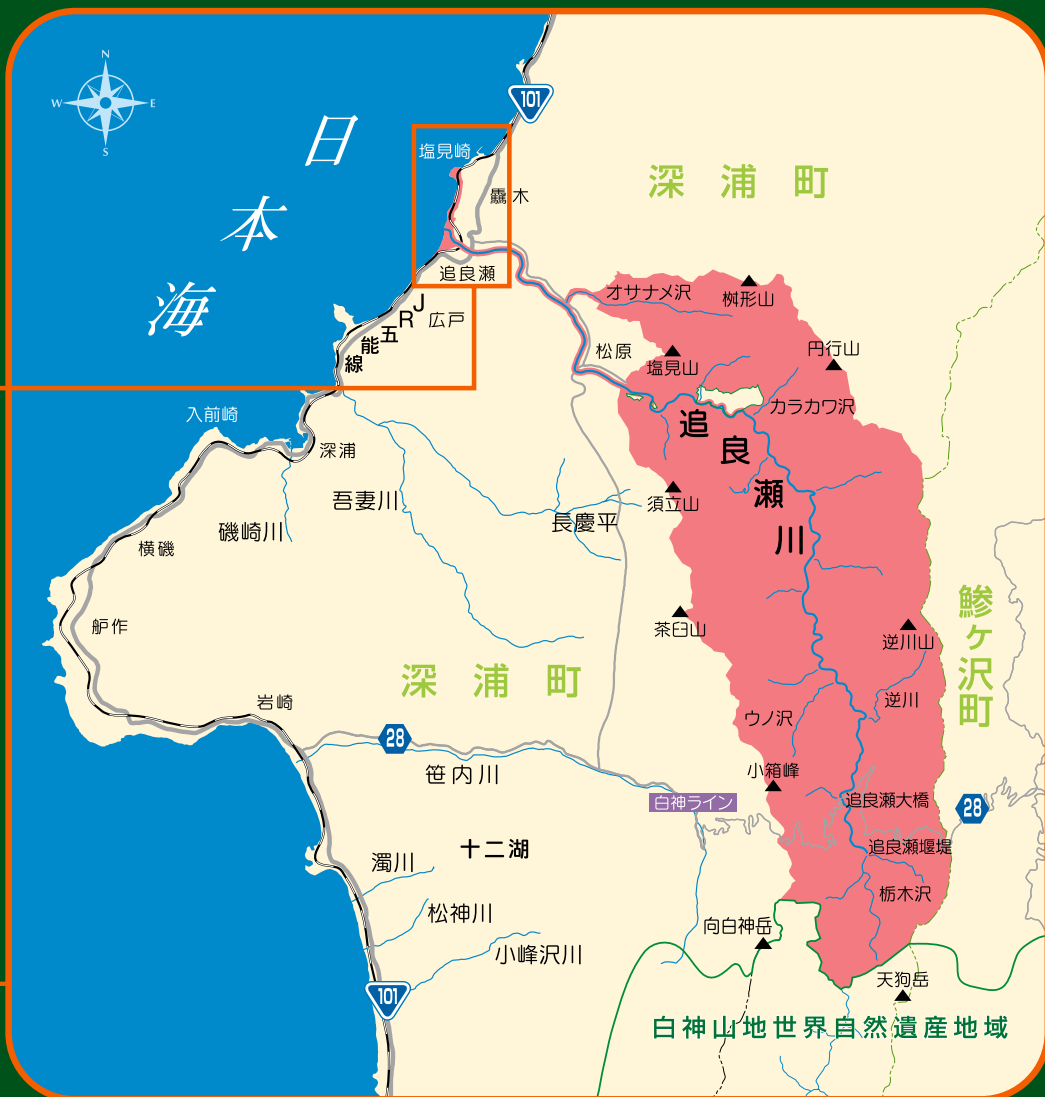
追良瀬川流域ふるさとの森と川と海保全地域

「保全地域」とは、人々の生活と深く結びつきながら、 文化を育ててきた豊かな森と川と海があるところです。