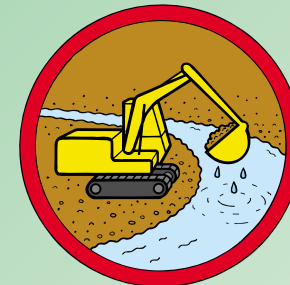
土石(砂を含む)の採取

保全地域では、特定行為について 届出 を行う必要があります。 特定行為とは次のものです。