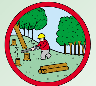
竹木その他規則で定める物の伐採