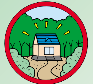
工作物の新築、増築、改築、移転または撤去